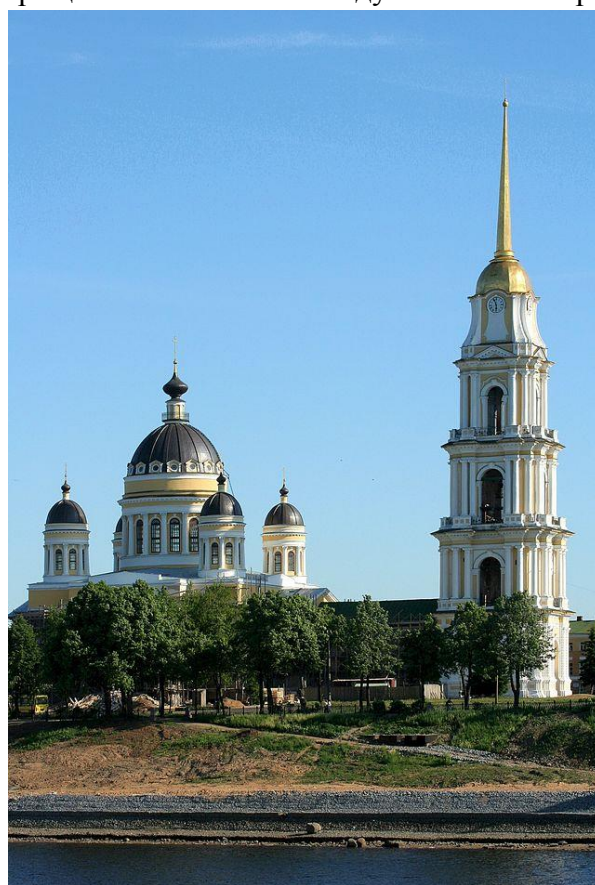
Спасо-Преображенский собор в Рыбинске

В Риме изучал древние памятники и за превосходную реставрацию капитолийских