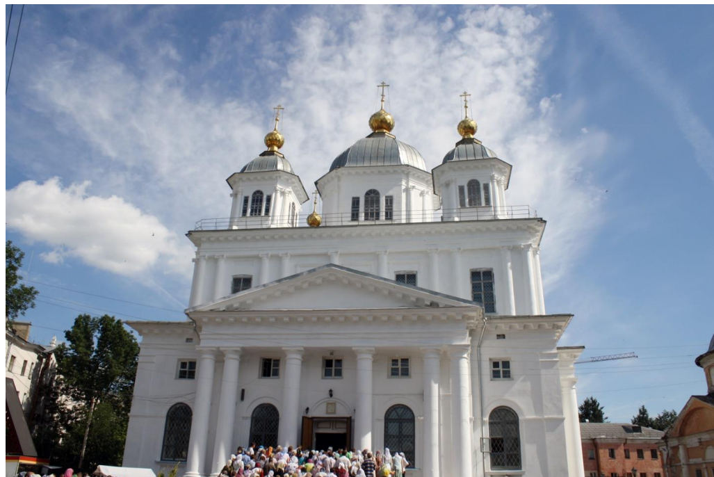
Собор Казанского монастыря, Ярославль

бань избран в члены Академии св. Луки. По возвращении своём в 1811 году в Санкт-Петербург стал преподавать архитектуру в Академии художеств и через несколько лет после того поступил также на службу в комитет строительных и гидравлических работ.