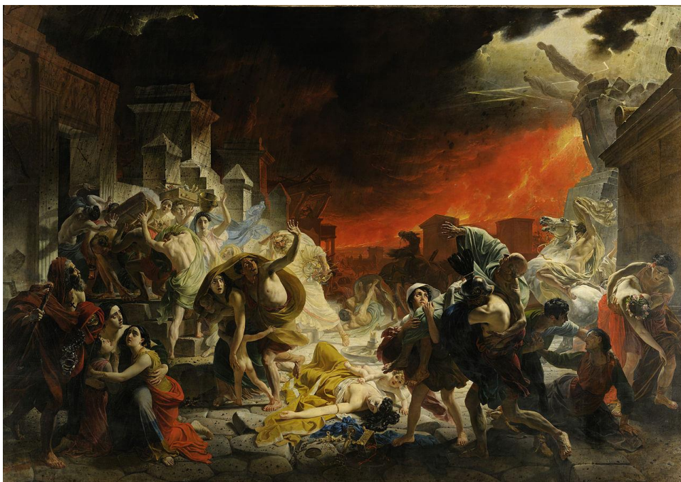
Последний день Помпеи, 1830—1833. Государственный Русский музей, Санкт-Петербург, Россия

мам, начинает в 1830 работу над Последним днем Помпеи (побывав на месте раскопок древнеримского города, разрушенного извержением Везувия). Многофигурное трагическое полотно становится в ряд характерных для романтизма (в том числе для творчества Т. Жерико, У. Тёрнера, Дж. Мартина) «картин-катастроф». Помпея Брюллова (завершенная в 1833 и хранящаяся в Русском музее) производит сенсацию как в